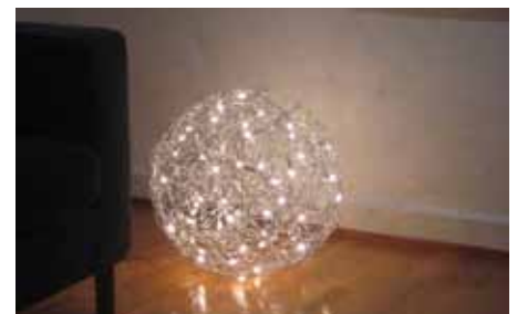
Trassel, en svensk klassiker